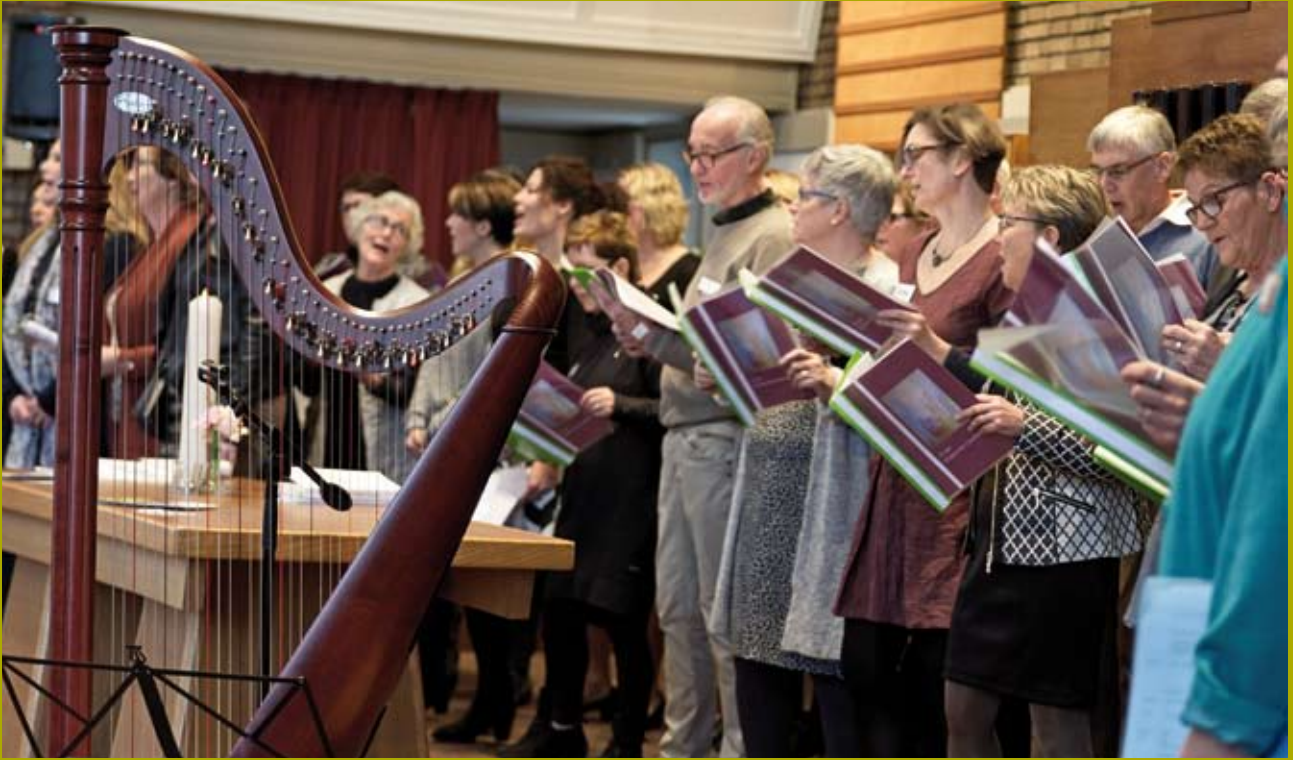
Het voor de gelegenheid opgerichte Clarakoor